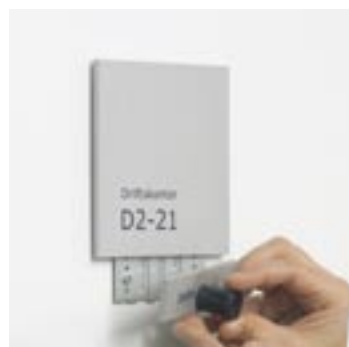
PlanSign magnetlåsesystem Det låste skilt frigøres ved brug af magnetnøglen