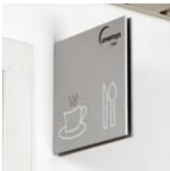
Vingeskilt med pictogram

Let at montere. Skiltet fastholdes mod monteringsbeslaget med specialudviklede aluminiums nitter, som går i indgreb med spor på skiltets bagside.