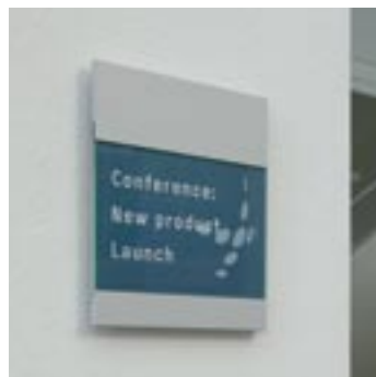
A5 paperflex skilt