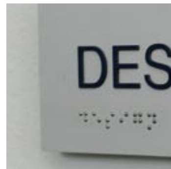
Vægskilt med blindskrift