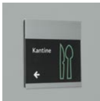
A5 paperflex skilt